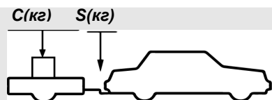
верное размещение груза